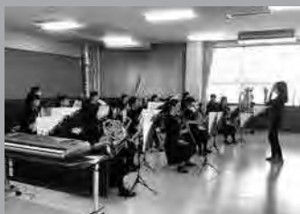
今津中学校 吹奏楽部

今津中学校吹奏楽部は、この春も 1年生を迎え、新しいスタートをき りました。私たちのモットーは、『ま わりのすべてのものに感謝する心。 誰からも応援していただける部』で す。先輩たちが築いてくれた「自分 たちで考え、よい行動をする」こと